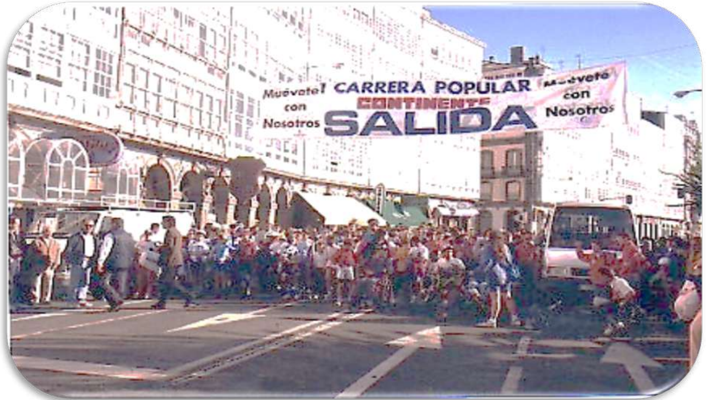
Saída en 1996, da 1ª edición, co nome de "Carreira Popular"