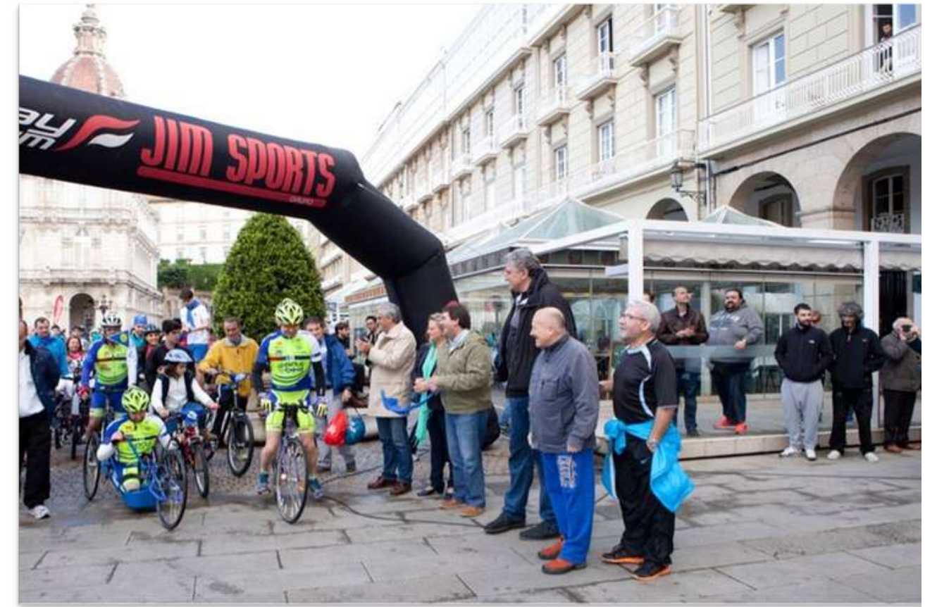
Saída dende a Praza de María Pita